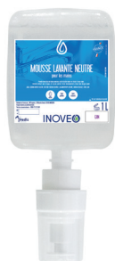
Mousse lavante neutre 1L Réf. 140866